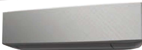
Modello KETF-B Dark Grey + Silver