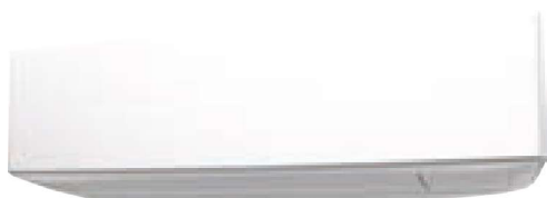
Modello KETF White + Pearl White