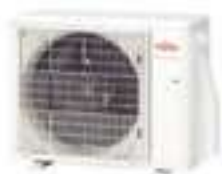
per ASYG07/09/12KETF ASYG07/09/12KETF-B