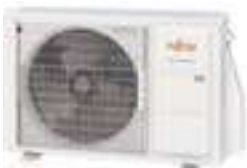
per ASYG14KETF ASYG14KETF-B